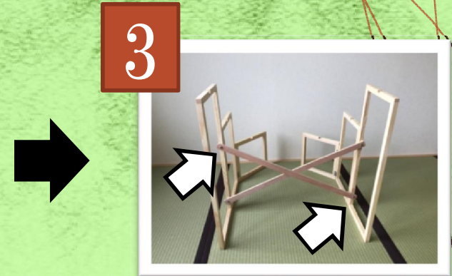
③接続棒を交差させる