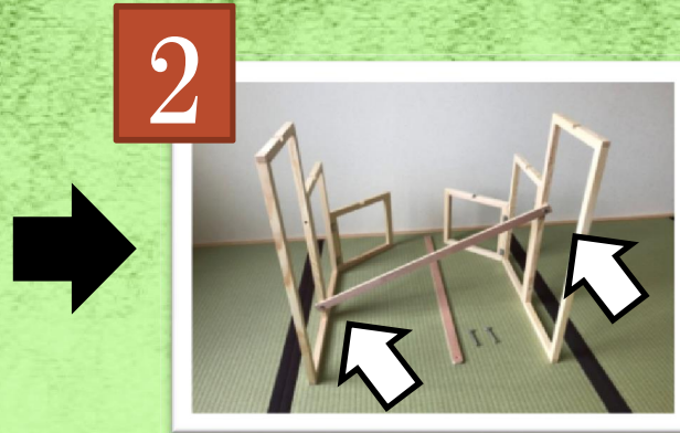
②骨組みを開いて立てる 接続棒を図のようにネジで固定する