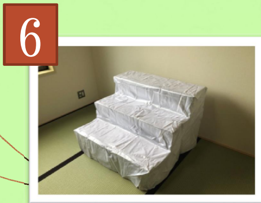
⑥カバーをつけて完成